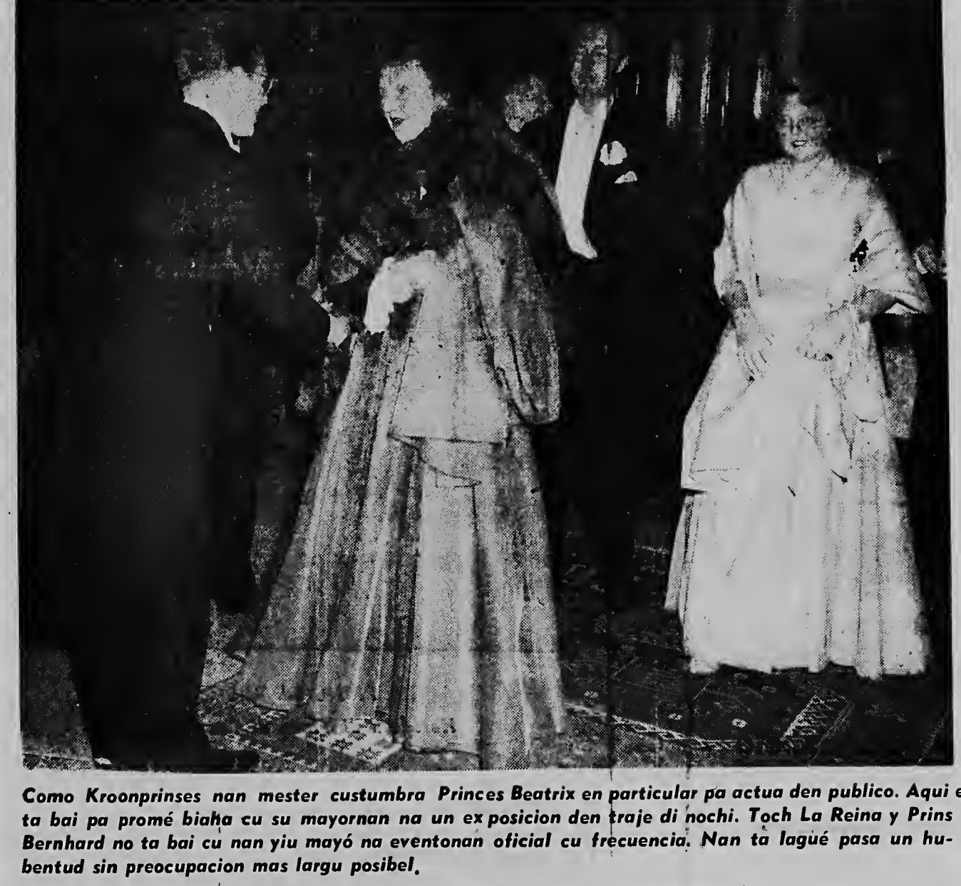
Como Kroonprinses nan mester custumbra Princes Beatrix en particular pa actua den publico. Aquí ta bai pa promé biaha cu su mayornan na un exposicion den traje di noche. Toch La Reina y Prins Bernhard no ta bai cu nan yiu tabata na eventonan oficial cu frecuencia. Nan ta lagué pasa un buentud sin preocupacion mas largu posibel.

A PERDE UN SACU DI PLACA ORANJESTAD. — Senjora C. di San Nicolas a bin duna op na polis na Oranjestad, cu diarazon e a perde un sacu cu Lago ta duna placa aden, entre Dr. Hagens y Botica del Pueblo. Den e sacu tabata tin tres billete di fl. 100.—, uno di fl. 50.— y uno di fl. 25.—.